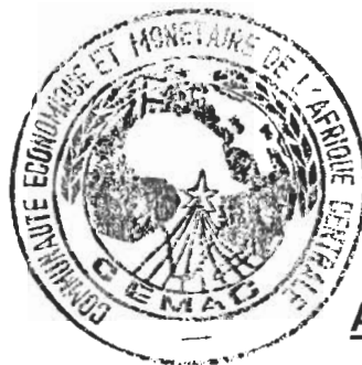
Ange Félix PATASSE

Fait à LIBREVILLE LE 23 Janvier 2003 LE PRESIDENT DE LA CONFERENCE DES CHEFS D'ETAT DE LA CEMAC